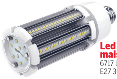
Led Energie maissilamppu 6717 LED-maissilamppu E27 36 W 4320lm 4500 K 8,90€