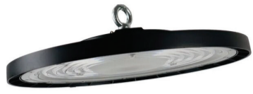
Hallivalaisin 9452 Hallivalaisin 100W 10000lm 4000K IP44 29,90€