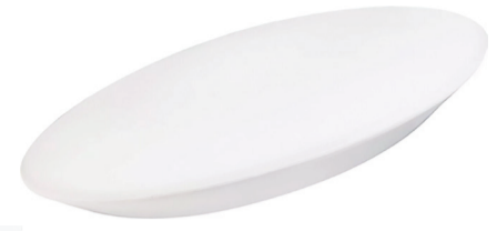
9410 LED Kattovalaisin VEGA 12W 1020lm 4000K Ø380mm IP20 14,90€