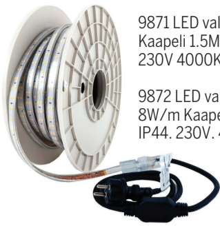
9871 LED valonauha, 15m, 12800lm, 8W/m Kaapeli 1.5M H07RN-F 2x1.5mm². IP44. 230V 4000K 39,90€