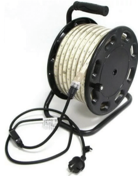
10102 Valonauha 230V kelalla 15m 1500lm/m 4000K IP44 67,90€