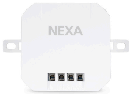
WBT-230 BUILT IN TRANSMITTER