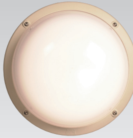
Protect 001 with LED light source and sensor